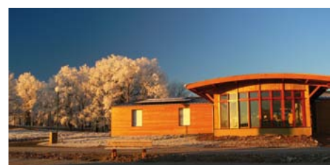
Le Vert Plateau à Bellenaves

135 €/pax (en single) - 107,50 €/pax (en double) - petit déjeuner - déjeuner et dîner - 2 pauses - une salle de réunion (tarif TTC 2012).