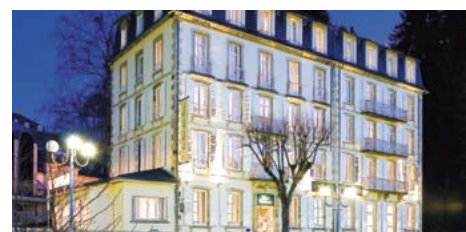
© A.S. Jal - Le Parc des Fées

NOUVEAU : CHALLENGE ECO-LOISIRS au Lac Chambon (à partir de 30 € TTC/personne - base 30 pax) une sensibilisation ludique au développement durable dans des actions quotidiennes personnelles et professionnelles, et différents ateliers au choix : chasse aux produits isolants, recycler juste, quoi manger quand, défi robinson, Initiation au GPS . . . Un produit d'Auvergne Loisirs.