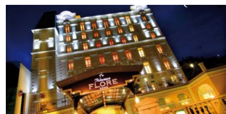
Le Princesse Flore

Le Princesse Flore , au cœur de la station de Royat, domine la ville de Clermont-Ferrand et offre, grâce à son accès direct au centre thermoludique Royatonic, un site idéal pour des séminaires « bien-être ». Il permet de profiter à loisir des piscines et bains d'eau thermale, des lits à bulles, des jets de massages, du bain parfumé, du contre-courant, des banquettes bouillonnantes, des jacuzzis, hammam et saunas . . . pour de purs instants de détente entre deux séances de travail.