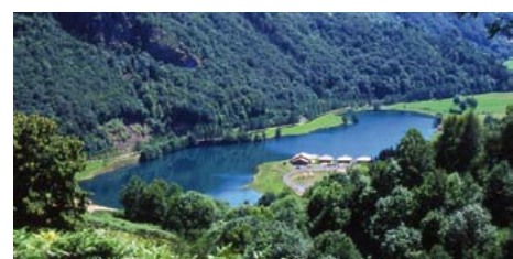
© B. Delva - Le Parc des Fées