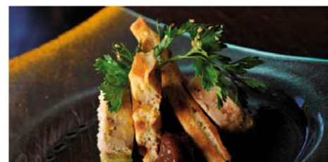
Le Jardin du Pariou

Boostée par de nouvelles demandes, l'hôtellerie auvergnate se développe sur le haut de gamme et compte à ce jour 10 hôtels 4 étoiles et 2 hôtels 5 étoiles, triplant en 5 ans son offre 4 étoiles et plus. L'ouverture d'un Mercure**** de 120 chambres est annoncée en 2013, place de Jaude, au cœur de Clermont-Ferrand.